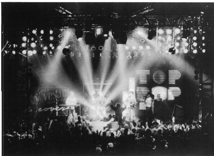
Veel licht bij AVRO's Discovery.

In de hal hangt een gigantisch lichtstelsel, staat een waanzinnig groot podium en een stevige geluidsinstallatie. Kortom, apparatuur, die elk popfestival van enig Europees belang graag zou gebruiken. De totale podiumoppervlakte van de artiestenbühne en de aparte disco unit bedraagt tweehonderd vierkante meter. Vijftien mensen zijn twee dagen lang bezig alles op te bouwen. De licht- en geluidsinstallatie kost plus minus tweeënhalve miljoen gulden! Het geluidsvermogen bedraagt ongeveer 30.000 watt! De lichtinstallatie met een totaalvermogen van 400.000 watt bevat zo'n 300 lampen. Lichten in alle soorten, waaronder robotlights, PAR 64 blazers, basic-, point- en strobolights en volgspots, hangen verspreid over de vier hoeken van de zaal. Alles gaat met computergestuurde afstandsbediening, zodat het licht kantelt, draait, wentelt, flinkt en knippert. Extra effecten zijn er in de vorm van rookmachines, neonbakken en een schrijvende